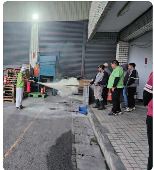
三商家購 2024 年舉行總部緊急應變演練