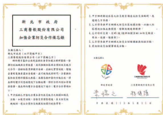
三商餐飲 2024 年新北市政府企業防災合作備忘錄

三商餐飲一向重視職場安全與員工福祉，並秉持責任與社會責任，2023 年與中和區公所簽署企業防災合作備忘錄，並於 2024 年更進一步與新北市政府簽署企業防災合作備忘錄。此次合作旨在進一步強化企業在防災應變、緊急處置及災後復原等方面的能力。未來，三商餐飲希望藉此合作，能在提升企業防災能力的同時，貢獻社會，為構建更安全、穩定的工作環境奠定堅實基礎。