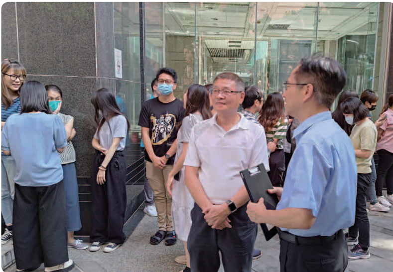
三商餐飲 2024 年舉辦總部與門市緊急應變演練

旗下子公司皆定期安排緊急應變訓練，藉由和消防局共同舉辦火災演習以及消防設備使用演練，達到緊急應變教育訓練目的，讓員工能夠正確了解並掌握逃生觀念與應急處置技能。並進行實地演練，確保員工在面對突發狀況時能迅速而有效地採取行動。藉由這些訓練，旨在提升全體員工的應變能力，從而保障公司及員工在災難情境中的安全。