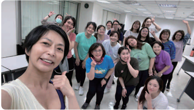
三商餐飲 2024 年運動課程

為了激勵同仁重視健康，三商餐飲自 2023 年起開辦了下班後的免費運動課程，2024 年度起開放跨公司同仁參與上課，課程內容豐富，包含肌力訓練、有氧或間歇訓練、器材健身輔助等。每季約開辦 24 堂運動課程，每堂 20 位名額，每季支出費用約 6 萬元。