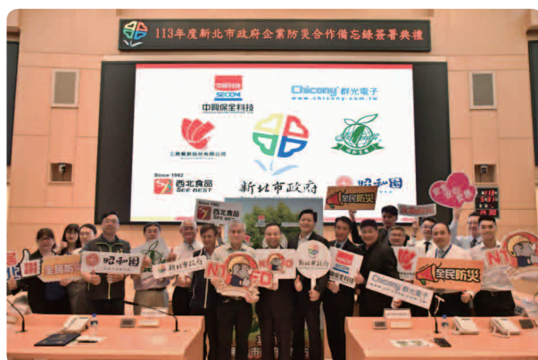
三商餐飲 2024 年與新北市政府企業防災合作備忘錄簽署典禮