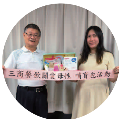
三商餐飲哺育包贈送

旗下子公司依據《職業安全衛生法》制定勞工健康保護四大計畫並推動執行，公司內均設有醫護室、哺乳室等健康照護設施，且依法設置專責勞工健康服務護理人員（簡稱職護）及臨場服務醫師。