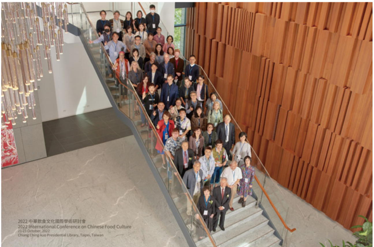
2022 中華飲食文化國際學術研討會 2022 International Conference on Chinese Food Culture 21-23 October, 2022 Chiang Ching-kuo Presidential Library, Taipei, Taiwan

2021 中華飲食文化國際學術研討會因疫情延期到 2022 年於蔣經國總統圖書館舉辦，主題為「生物與生態觀點下的中華飲食文化」，共 2 場主題演講，31 篇國內外學者論文發表。下一次研討會將於 2024 年與日本京都大學合辦，主題為「永續飲食文化讀比較研究」。