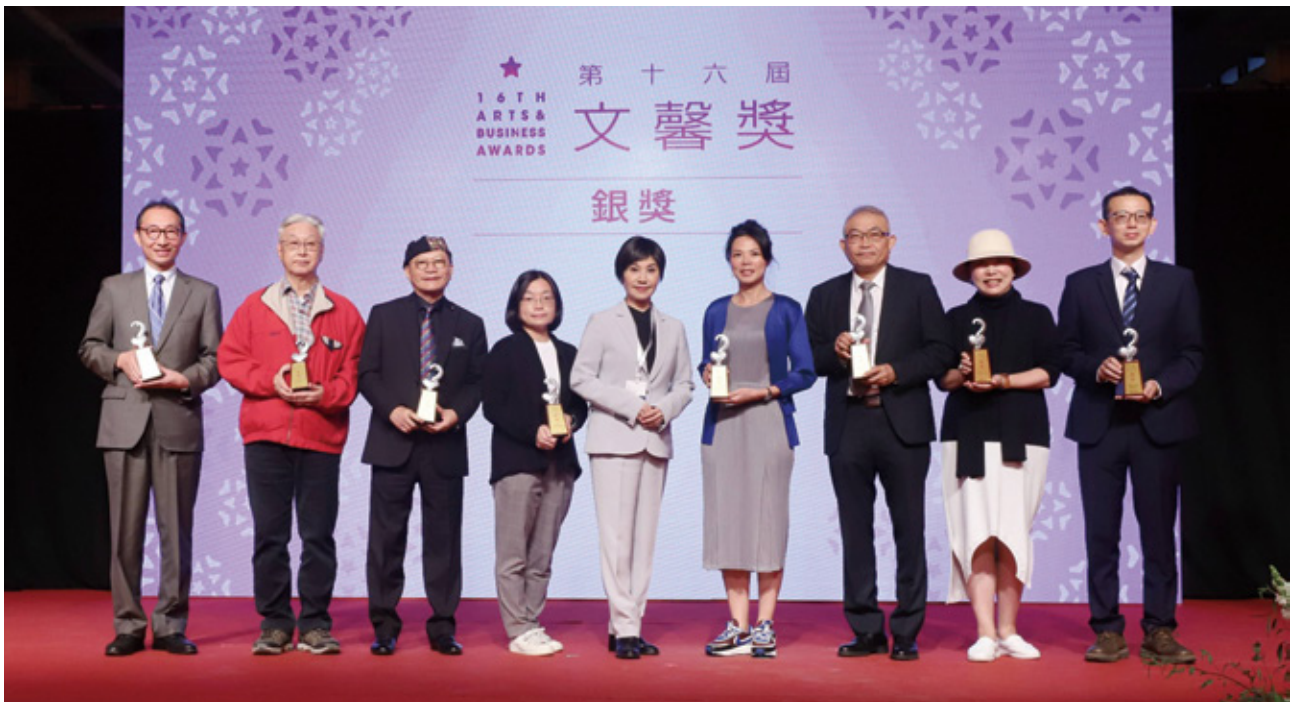
中華飲食文化基金會榮獲文馨獎銀獎 (左四)

文馨獎是由文化部頒發的獎項，每 2 年一屆，其目的為表彰對臺灣藝術文化之維護與發揚有特殊貢獻之企業、團體或個人，結合政府及民間力量，共同營造優質文化環境。2023 年第 16 屆文馨獎總贊助金額逾新臺幣 18 億元，中華飲食文化基金會榮獲文馨獎常設獎銀獎。