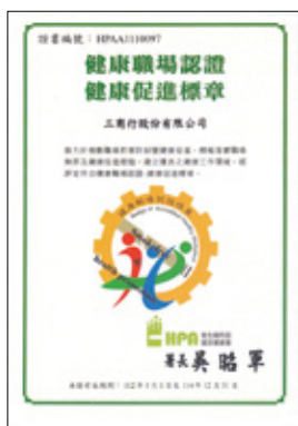
三商行股份有限公司（總部）