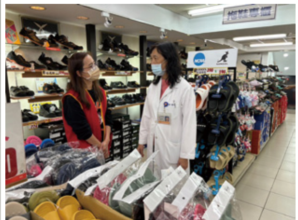
臨場醫師至門市執行健康風險評估、員工關懷