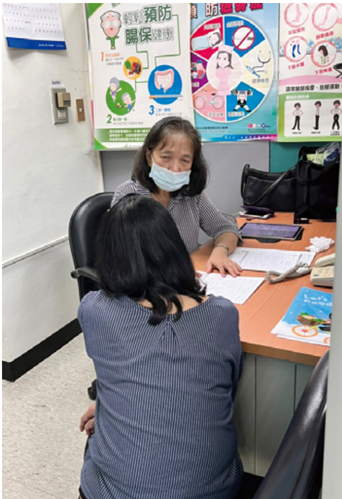
每月臨場醫師駐點諮詢

針對外包或承攬商人員，則根據《承攬商管理辦法》要求廠商在派遣人員進場前，應確認勞工身體健康狀況，並確認勞工已完成健康檢查（包含特殊作業健檢）、投保勞保、健保相關保險或加入工會，以確保勞工安全與權益。員工於工作中若有身體不適或健康諮詢之需求，也可立即至醫護室尋求協助，本公司致力確保職場內員工及非員工工作者皆受到妥善照顧。