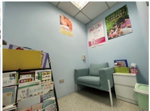
總部設有醫護室、哺乳室等健康照護措施