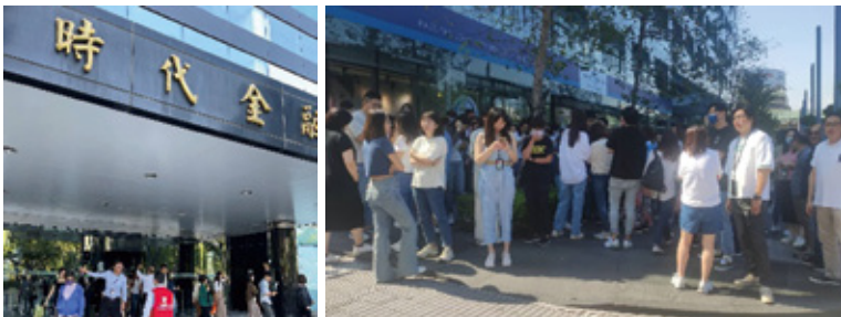
三商家購 2023 年舉行總部緊急應變演練