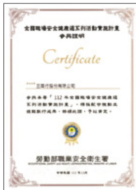
三商行股份有限公司