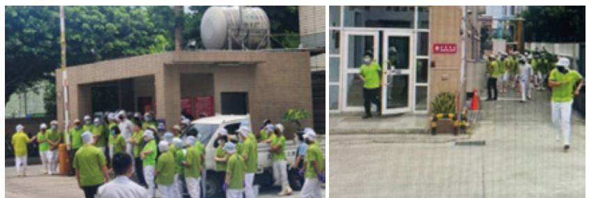
三商餐飲中央廚房於 2023.06.14 舉行緊急應變演練

旗下子公司皆定期安排緊急應變訓練，藉由和消防局共同舉辦火災演習以及消防設備使用演練，達到緊急應變教育訓練目的，讓員工都能接受到正確的逃生觀念，進而保障公司與個人生命財產安全。