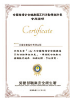
三商餐飲股份有限公司