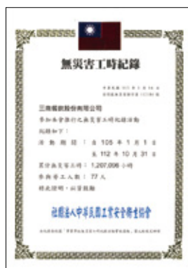
三商餐飲股份有限公司總部