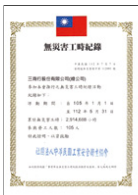
三商行股份有限公司總部