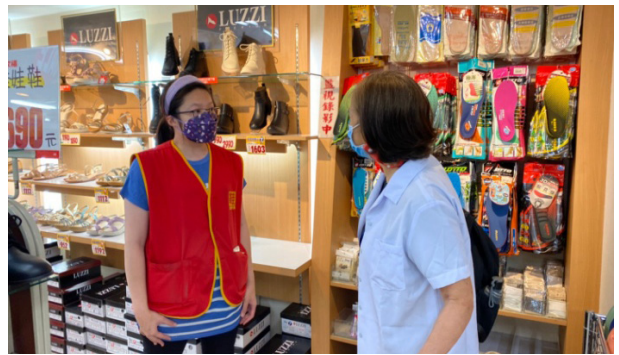
三商行臨場醫師至門市執行健康風險評估、員工關懷

醫護室每年定期與勞動部認可之醫療院所合作，安排同仁進行健康檢查，檢查項目皆依法規辦理，若報告有異常者，可透過面談、電話及郵件等方式與臨場醫師進行諮詢。員工健檢報告統一由職護進行管理與分析，再依分析結果規劃員工健康促進活動與講座。異常工作過度負荷評量問卷也會連同每年健康檢查同步實施，分為 0 至 2 級，並針對達 2 級的同仁安排與醫師進行面談，並持續關懷。