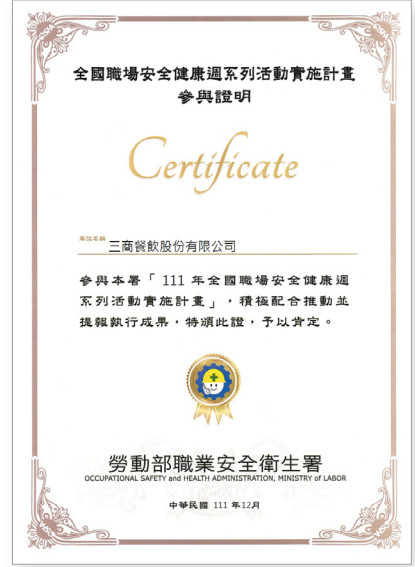
三商餐飲股份有限公司 2022年全國職場安全健康週參與證明