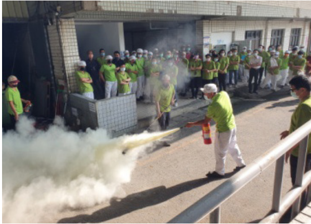
三商餐飲中央廚房於 2022.08.15 舉行緊急應變演練

三商投控旗下子公司定期安排緊急應變演練，藉由和消防局共同舉辦火災演習以及消防設備使用演練，達到緊急應變教育訓練目的，讓員工都能接受到正確的逃生觀念，進而保障公司與個人生命財產安全。