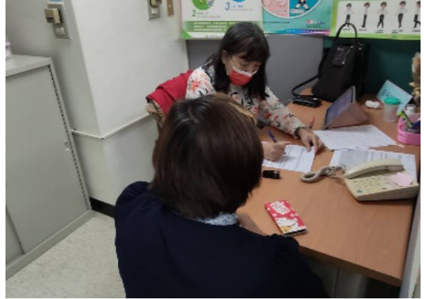
三商行、三商餐飲每月臨場醫師諮詢

三商投控旗下子公司皆聘有專責勞工健康服務護理人員（簡稱職護）及臨場醫師，提供職場健康照護關懷，並設置醫護室、哺乳室等健康照護設施，以確保職場內員工及非員工工作者皆受到妥善照顧。職護負責擬定勞工健康保護四大計畫並推動執行，每年利用相關風險評估表篩選出健康高風險個案之員工，安排其與臨場醫師進行面對面會談或是電話訪談，再依照相關報告及工作適性提供勞工職務調整之建議；員工若有身體不適或健康諮詢之需求，也可預約安排醫師訪談，落實初級疾病預防及衛生指導。