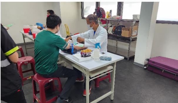
三商家購企業巡迴團體健康檢查

針對外包或承攬商人員，則根據《承攬商管理辦法》要求廠商在派遣人員進場前，應確認勞工身體健康狀況，並確認勞工已完成健康檢查（包含特殊作業健檢）、投保勞保、健保相關保險或加入工會，以確保勞工安全與權益。