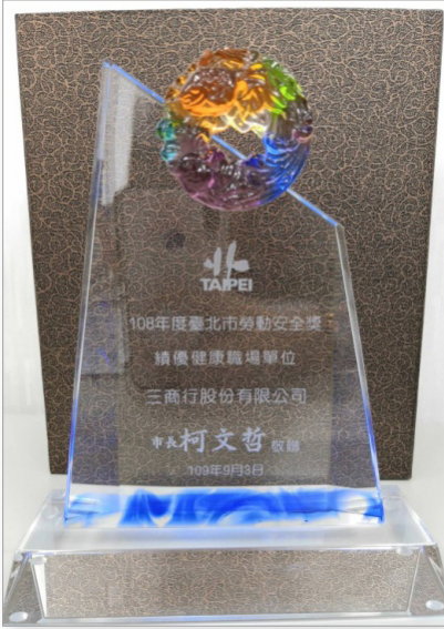
三商行股份有限公司 2019年績優健康職場單位獎