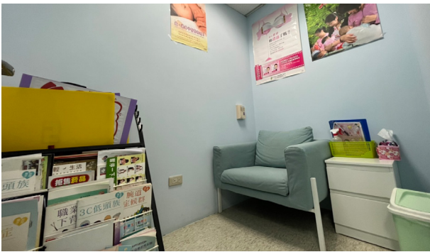
總部設有醫護室、哺乳室等健康照護措施