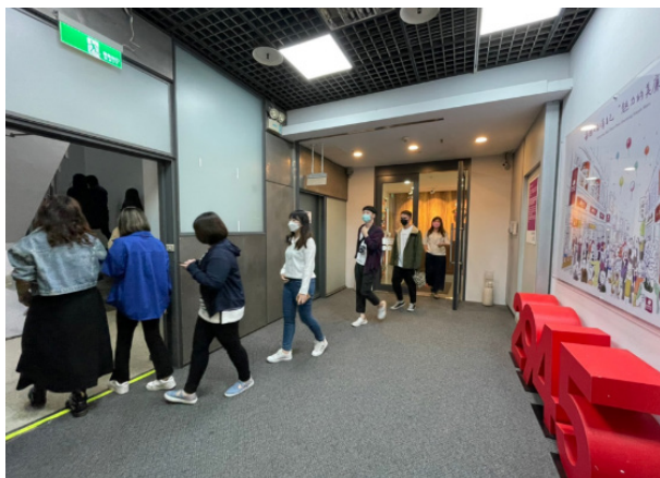
三商家購於 2022.11.04 舉行總部消防疏散演練