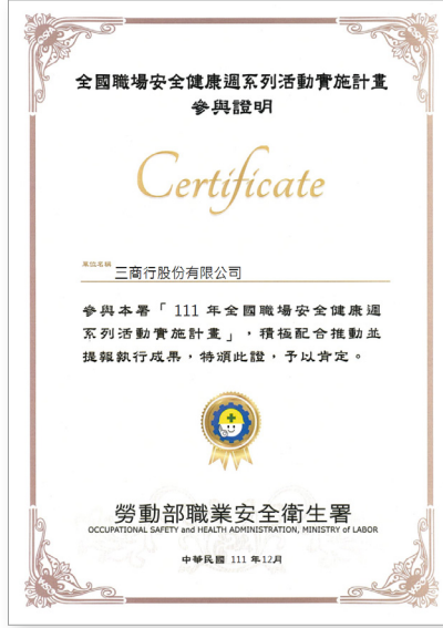
三商行股份有限公司 2022年全國職場安全健康週參與證明