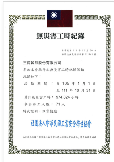
三商餐飲股份有限公司總部 累積無災害工時 974,024 小時