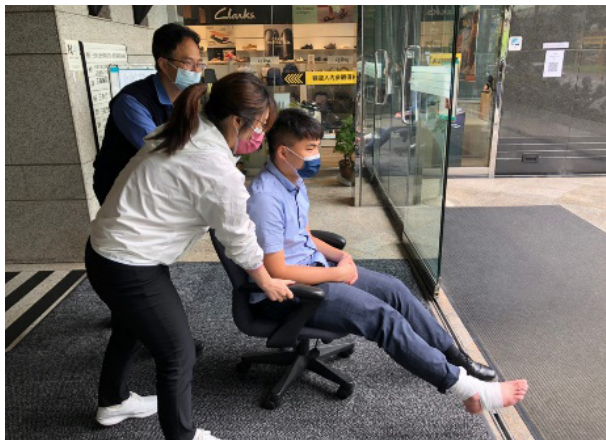
三商餐飲於 2022 年共舉辦總部 2 場、門市 1 場緊急應變演練